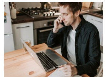
8 Overige eerder aangekondigde en te verwachten voorstellen